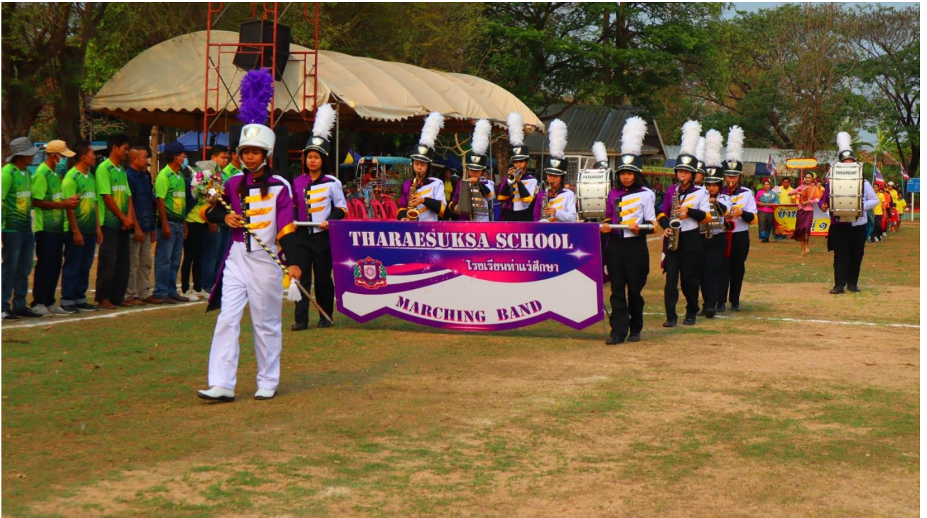
วงดุริยางค์นำขบวนนักกีฬาเข้าสู่สนาม