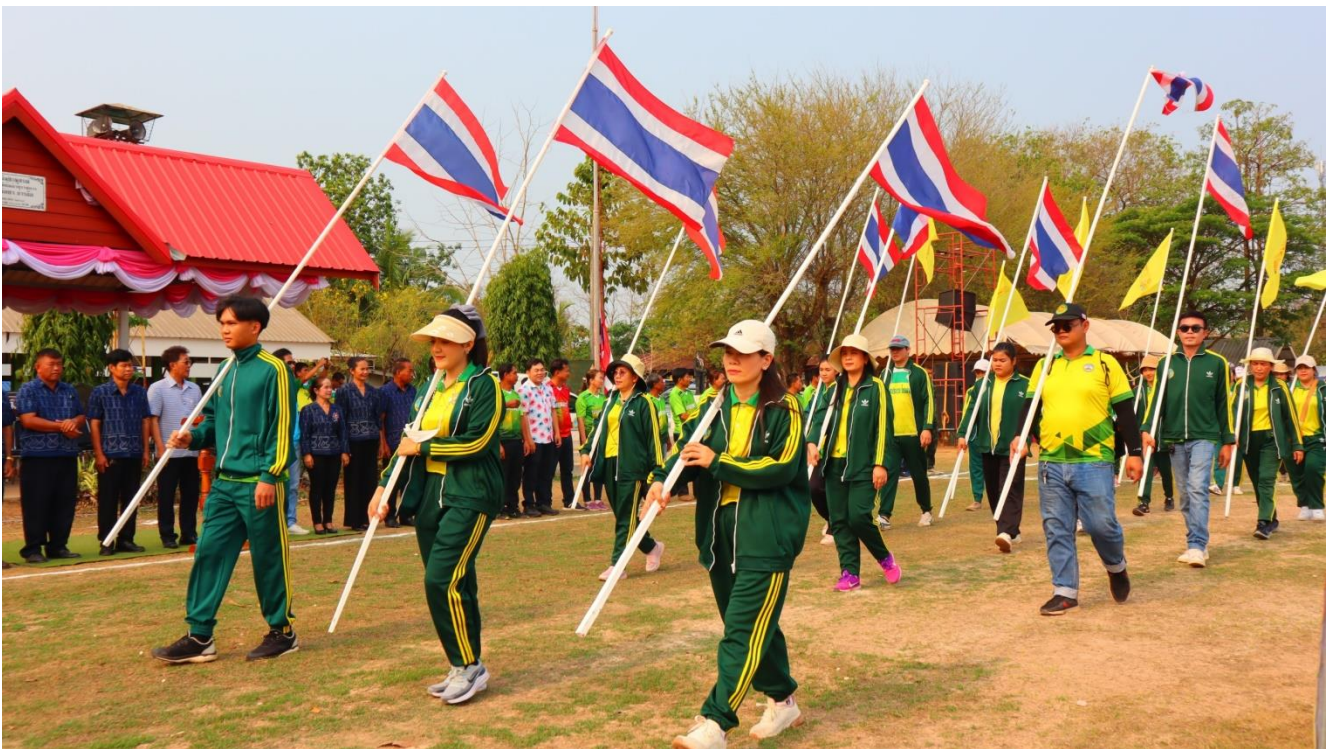
ภาพประกอบกิจกรรม