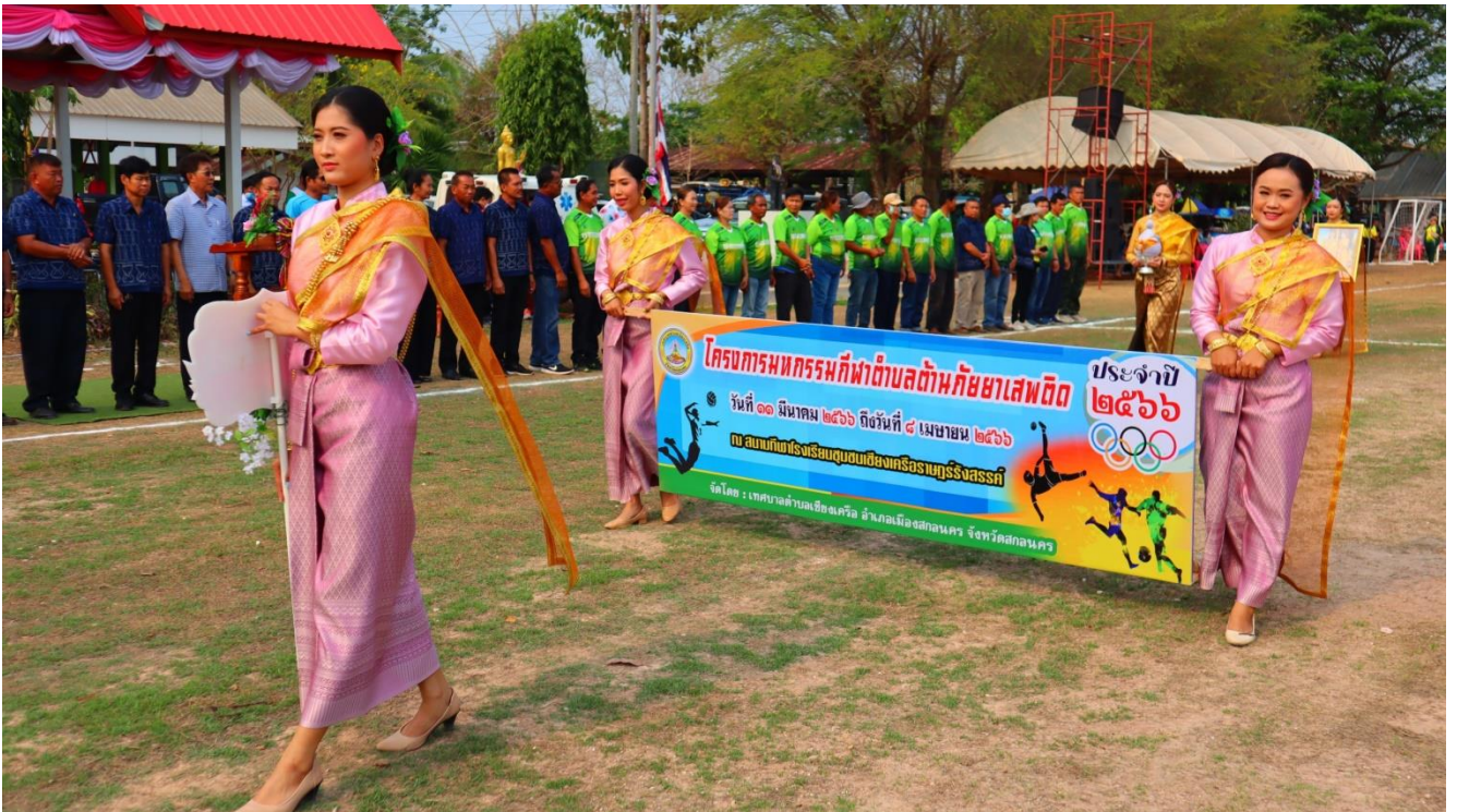
ภาพประกอบกิจกรรม