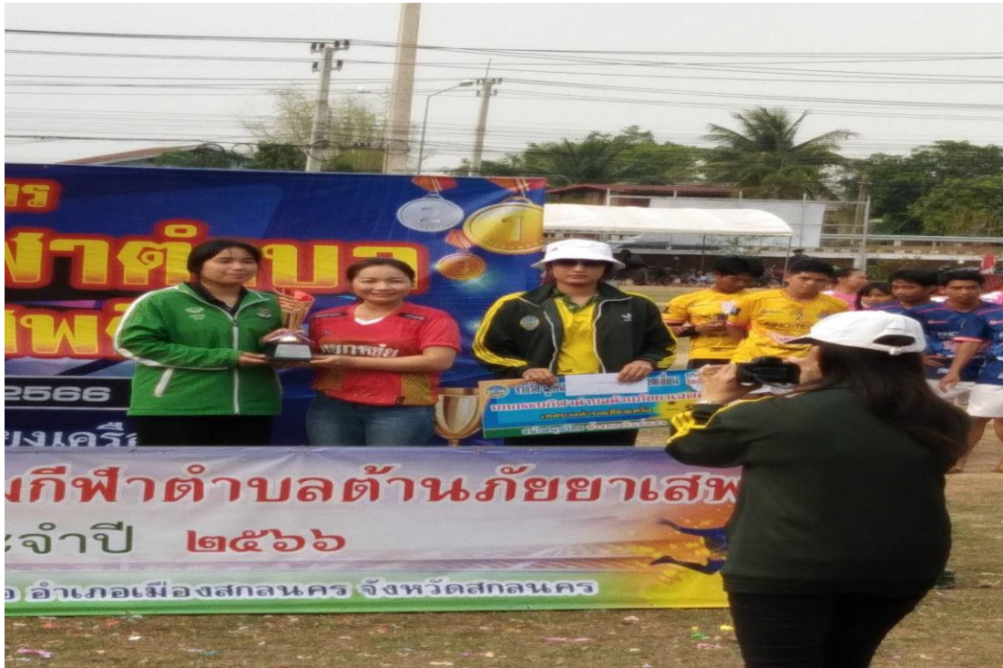
รับรางวัลการแข่งขันกีฬาประเภทต่างๆ

โครงการมหกรรมกีฬาตำบลครั้งที่ ๑๓ บ้านเชียงเครือ หมู่ที่ ๑