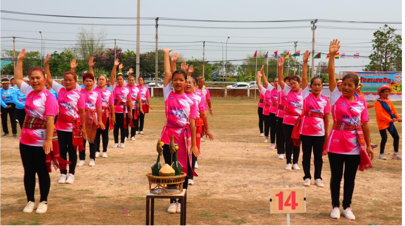
การแข่งขันแอโรบิครำผีหมอ สัญลักษณ์ของชาวตำบลเชียงเคี่ยน