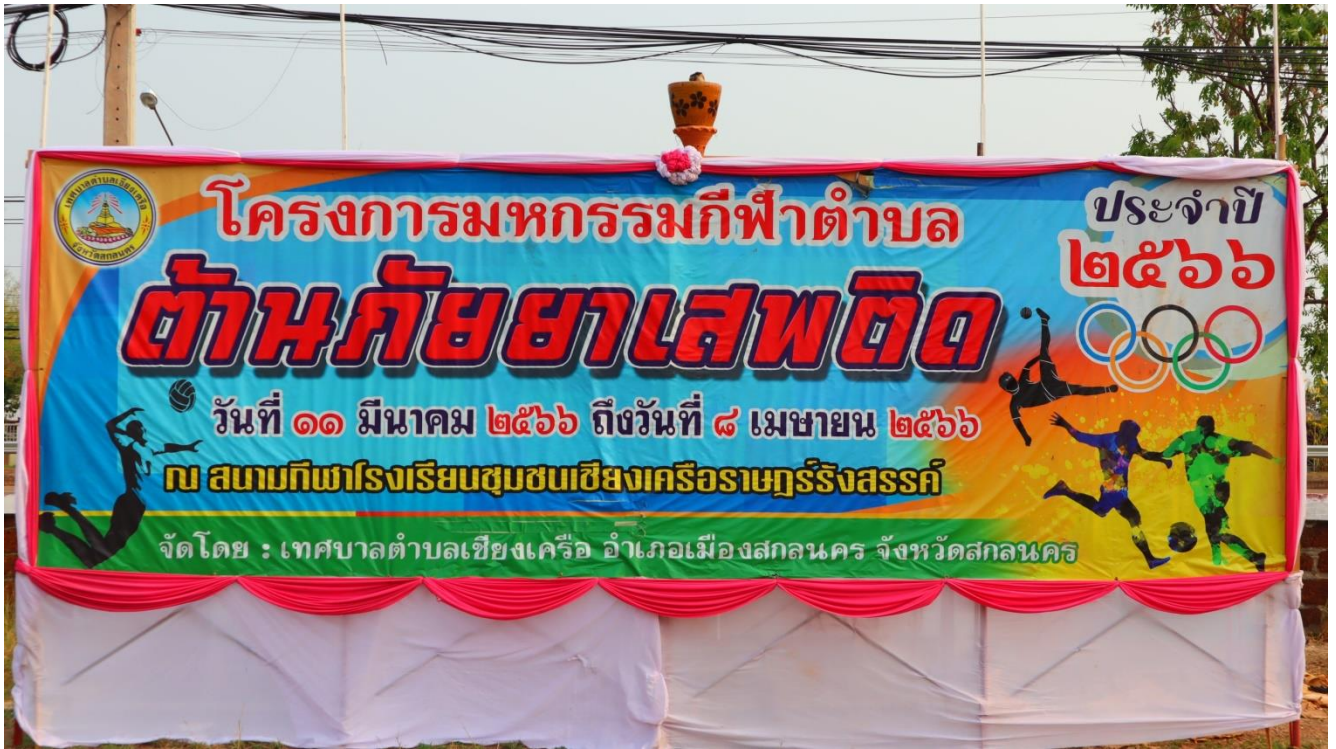
ป้ายงานโครงการพร้อมสาวงามผู้ถือป้ายโครงการ