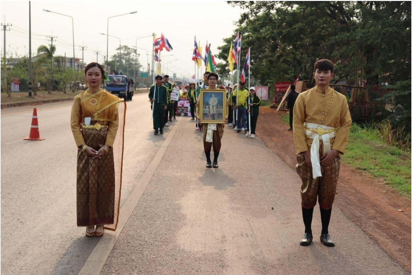
ขบวนพาเหรดสุดอลังการ