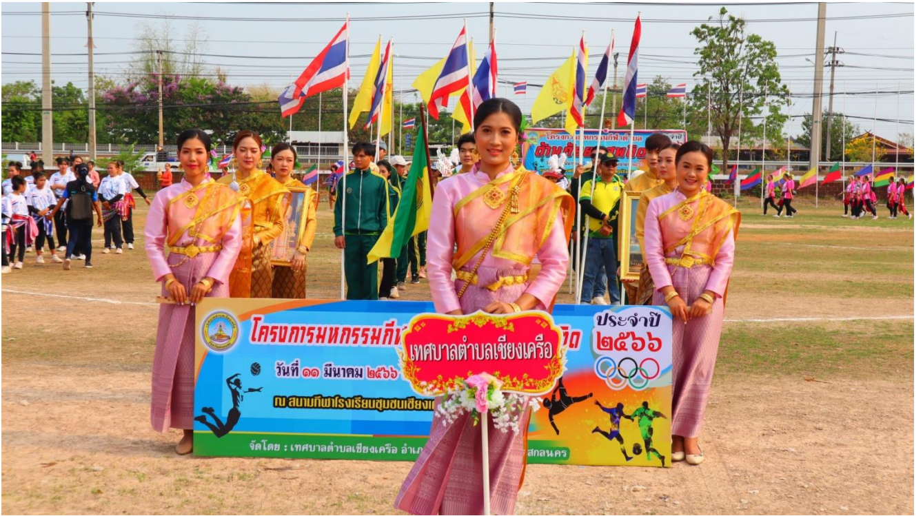
เตรียมความพร้อมขบวนพาเหรดพร้อมถ้วยรางวัลกีฬาต่างๆ